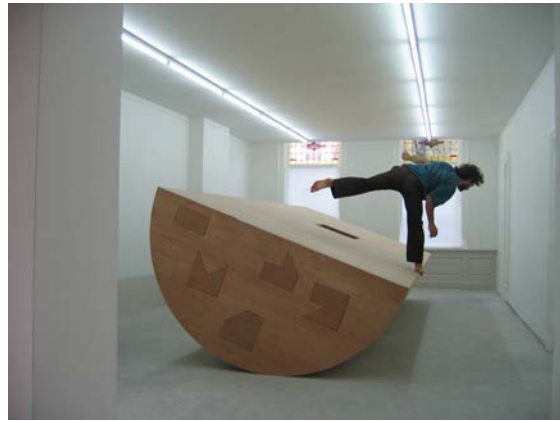
1 KIND - 2007, performative installation at West

Solo expositie met nieuw werk: 15 december 2013 — 25 januari 2014